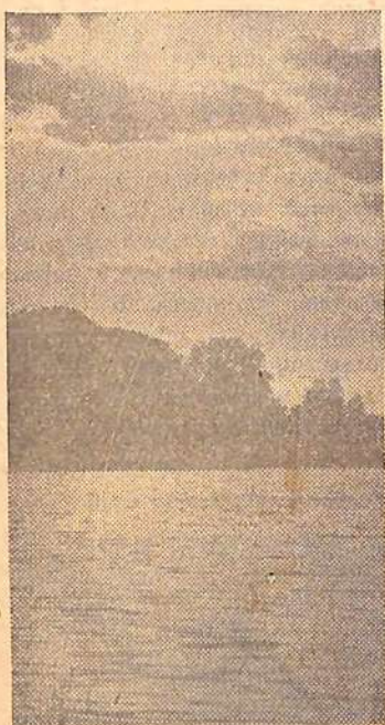
На Волге.