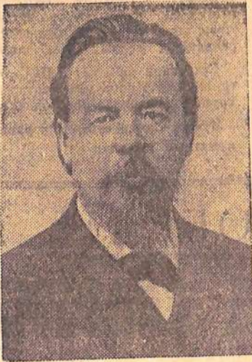
А. С. Попов.

кает в отдаленные уголки земного шара, помогает крепить друж-