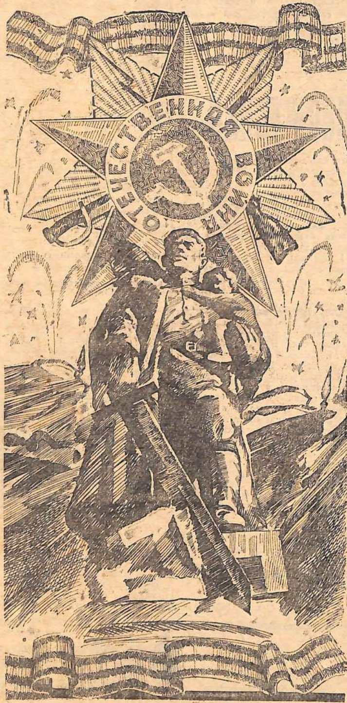
Плакат И. Полярного.

Факты показывают, что политику ФРГ определяют те же монополистические круги, которые в свое время привели к власти гитлеровскую клику. Именно эти круги, как свидетельствует в своей книге «Реваншизм—да или нет?» западногерманский публицист Петер Нау, питают и взращивают реваншистский дух. Западногерманские концерны и бан-