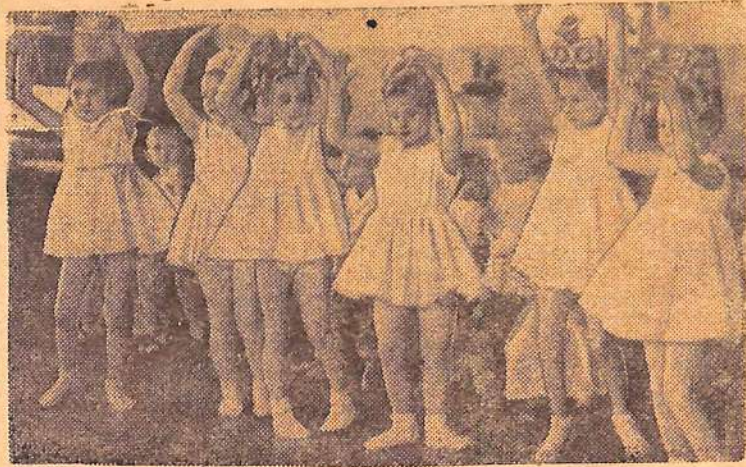
У детворы, как и у их мам и пап, сегодня большой праздник. Праздник весны, цветов и счастья. И они танцуют, поют песни, веселятся.