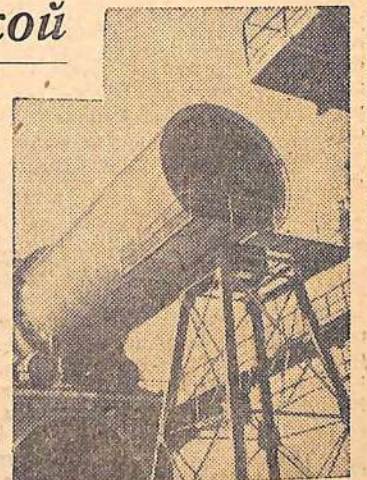
На крупнейшей стройке Армении — Разданском горнохимическом комбинате началась сборка вращающейся печи исполинских размеров. Этот гигант производительностью 5.000 тонн клинкера в сутки будет крупнейшим в Закавказье.