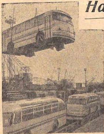
Работы в Находкинском порту не прекращаются ни днем ни ночью. Отсюда идут морские дороги на север Советского Дальнего Востока и в другие страны. На снимке: в находкинском торговом порту идет разгрузка железнодорожного состава с автобусами.

Между двумя съездами — XXII и XXIII съездом КПСС — появилась еще одна новинка — кубический нитрид бора (боразон) — новый сверхтвердый материал. Он не уступает по твердости природному алмазу, а по теплостойкости даже превосходит его. Инструмент из боразона расширяет возможности применения в машиностроении новых марок сталей и сплавов, которые не обрабатывались алмазами, повышает качество деталей, надежность и долговечность машин.