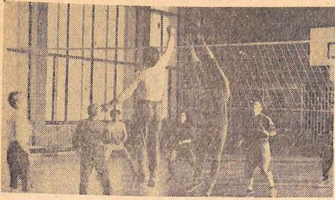
Спортивный зал в жилгородке никогда не пустует. Здесь проходят спортивные соревнования, товарищеские встречи, тренировки. На снимке: в спортивном зале.