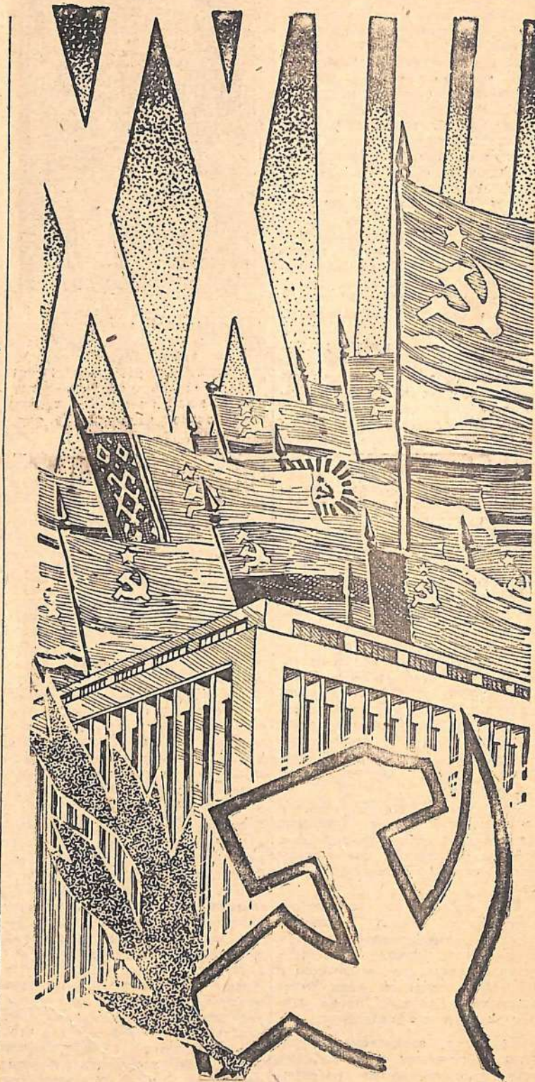
Плакат художника Р. Иванова.

Успешно идут дела и в отаре М. А. Силенкова. Здесь в разгаре окот. От каждой ста овцематок полу-