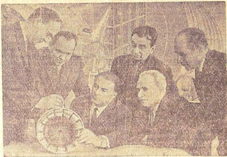
Группа специалистов Ленинградского Металлического завода имени XII съезда КПСС за создание сверхмощных радиально-осевых турбин Братской ГЭС представлена на соискание Ленинской премии.