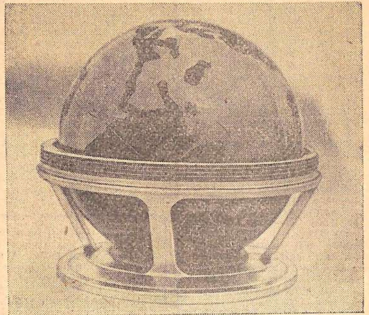
Вымпел, доставленный 1 марта 1966 года на поверхность планеты Венера советской автоматической станцией «Венера-3».