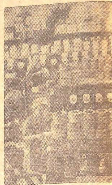
Около 2,5 миллиона метров ткани можно изготовить из вискозного шелка и штапеля, выпущенного сверх плана в 1965 году коллективом Ленинградского завода искусственного волокна. Химики не снижают темпов и в первом году пятилетки. Сверх программы уже выданы десятки тонн сырья для текстильщиков. Это подарок коллектива XXIII с'езду КПСС. На снимке: в перемоточном цехе предприятия.

Н. ИВАНЦОВ, начальник управления Саратовгэстроя.