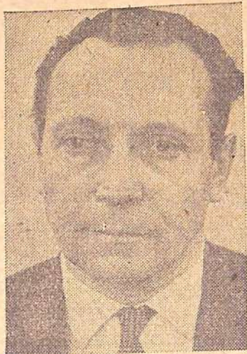
В этом году нам предстоит освоить около 100 миллионов рублей.

монтажных работ на 240 миллионов рублей, освоенных Саратовгэстроем за 7 лет, в последнем году семилетки строители освоили 72,8 миллиона рублей, что составляет 30 процентов семилетнего объема. Выполнены задания по производительности труда, снижению себестоимости строительно-монтажных работ.