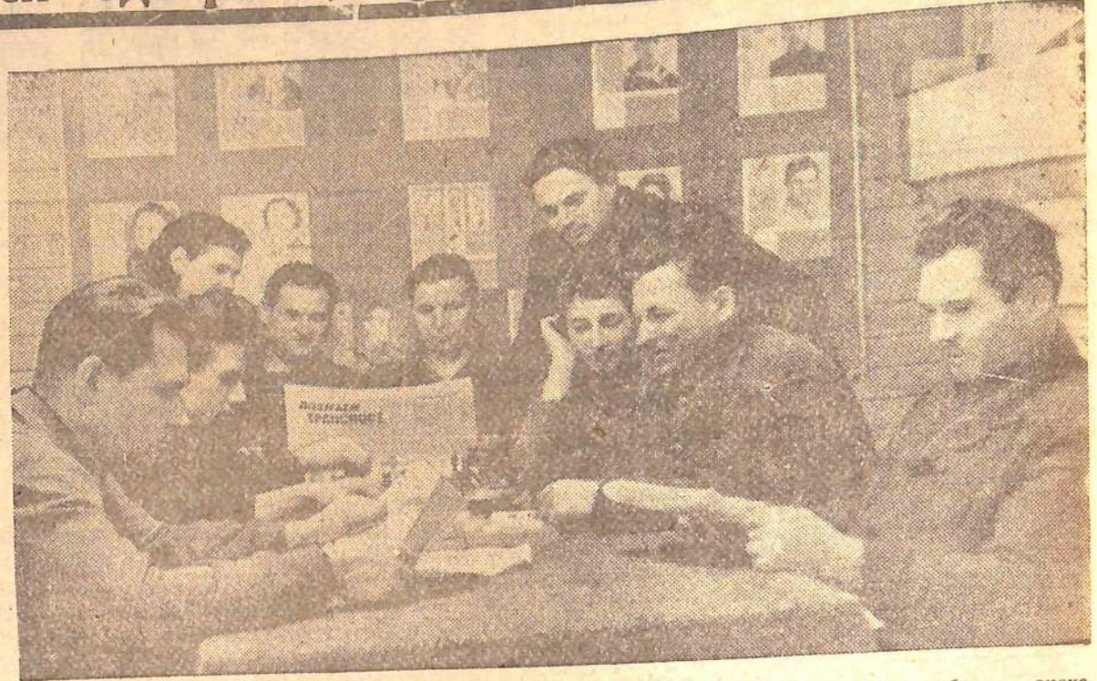
Широко развернулось обсуждение проекта Директив XXIII съезда партии по пятилетнему плану развития народного хозяйства страны на заводах, стройках, предприятиях и в учреждениях нашего города. В модельном цехе судоремонтного завода,

собравшись в красном уголке, рабочие знакомятся с проектом Директив.