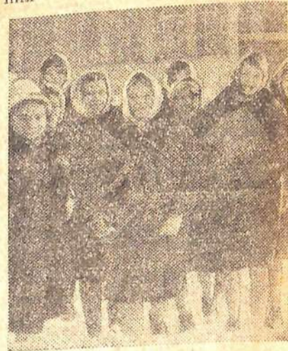
Текст В. Полтавца.

Сумерки сгустились над городом. Ярким электрическим светом залиты широкие окна техникума. Люди самых различных возрастов и профессий собрались здесь, чтобы овладеть знаниями, получить специальность. Начались занятия вечернего отделения.