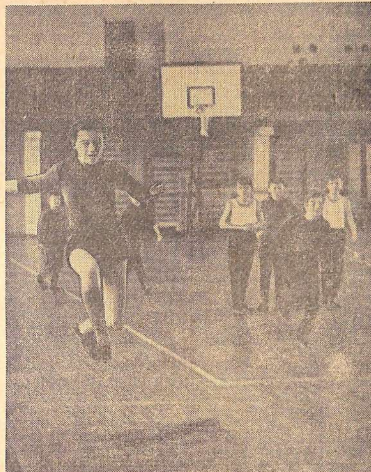
Детская спортивная школа. Идут тренировочные занятия по легкой атлетике.

За два года спортсмены комбината завоевали 6 переходящих призов областного Совета ДСО «Труд», горспортсоюза и более 50 грамот и дипломов.