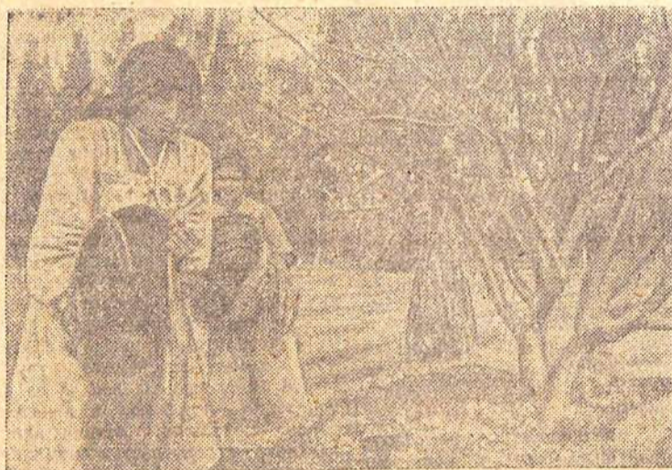
ОАР. Арабские крестьянки — жительницы новой деревни «Наср» («Победа») в провинции ат-Тахрир вносят удобрения на апельсиновые плантации.

84 жителя Западной Германии и Западного Берлина перешли за последние четыре дня в Германскую Демократическую Республику, сообщило агентство АДН.