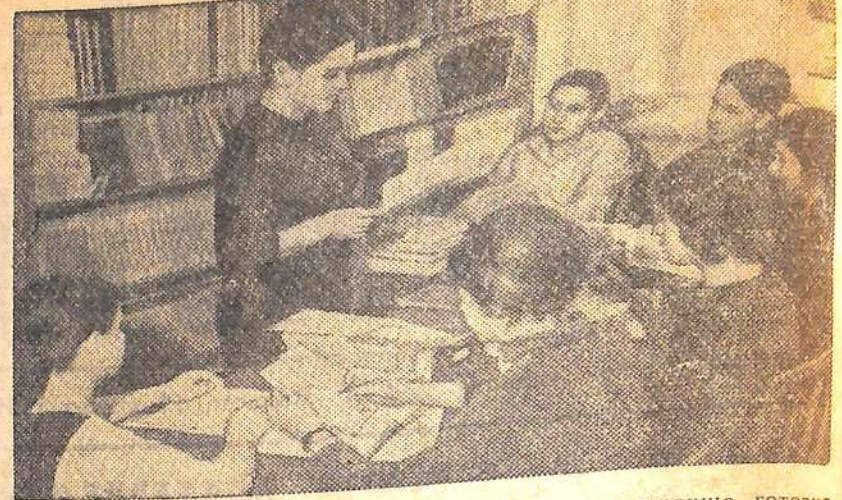
Брянское областное культурно-просветительное училище готовит руководителей театральных коллективов, дирижеров-хоровиков, руководителей коллективов народных инструментов. Здесь также открыто отделение работников массовых библиотек, на котором занимаются 40 человек.

влияния» взят на вооружение каждым агитатором. Уже есть