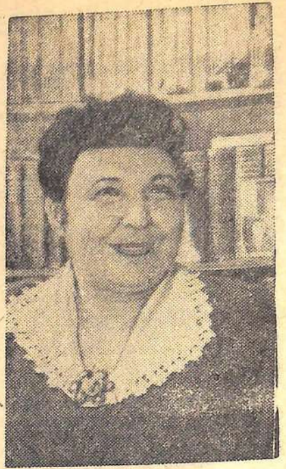
Серебрякова Галина Иосифовна, известная советская писательница—автор трилогии «Прометей» («Юность Маркса», «Похищение огня», «Вершина жизни») и других произведений. 20 декабря ей исполняется 60 лет.