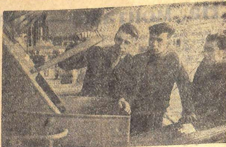
Башкирская АССР. Включившись в предсъездовское социалистическое соревнование, коллектив Уфимского завода синтетического спирта имени 40-летия комсомола обязался подготовить к пуску комплекс цехов «большого полиэтилена».

Прошло много лет, но сердце первой колхозницы свято хранит память о товарищах, отдавших жизнь за народное дело. В. БЕЗУГЛОВ.