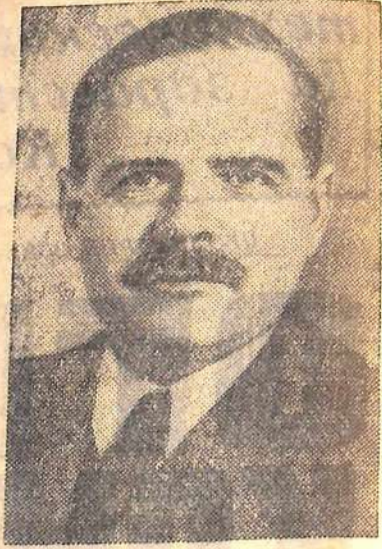
Андреев Андрей Андреевич, видный деятель Коммунистической партии и советского государства. 30 октября исполняется 70 лет со дня его рождения.

Собрание актива одобрило решения сентябрьского Пленума ЦК КПСС и выразило уверенность, что районная партийная организация примет все необходимые меры для мобилизации сил трудящихся района на выполнение решений мартовского и сентябрьского Пленумов ЦК КПСС и развернет широкое соревнование за достойную встречу XXIII съезда КПСС.