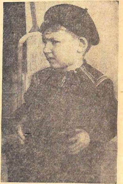
Я буду капитаном...