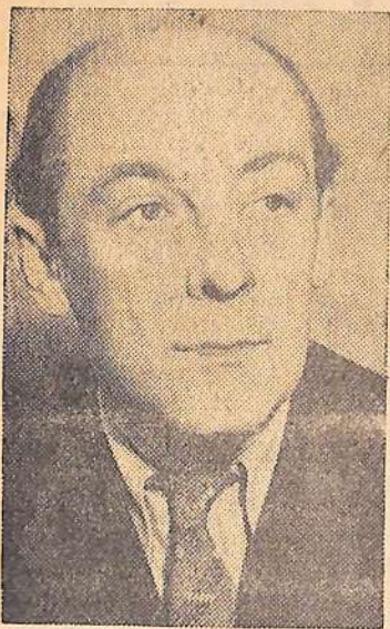
Писателю Г. С. Берзко исполнилось 60 лет.

Окончил Ленинградское хореографическое училище.