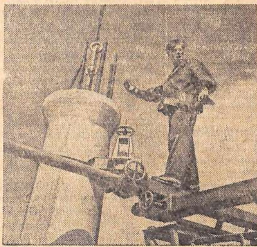
В Свердловске началось строительство шестэтажного корпуса холодильника для хранения мясных продуктов.

Свой концерт агитбригада также показала в доме отдыха «Черемшаны-2».