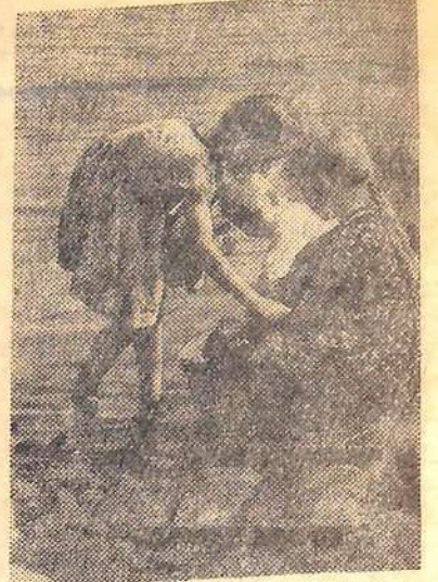
Живописные места в окрестно- стях села Пলেখаны. На снимке: на колхозном пруду.