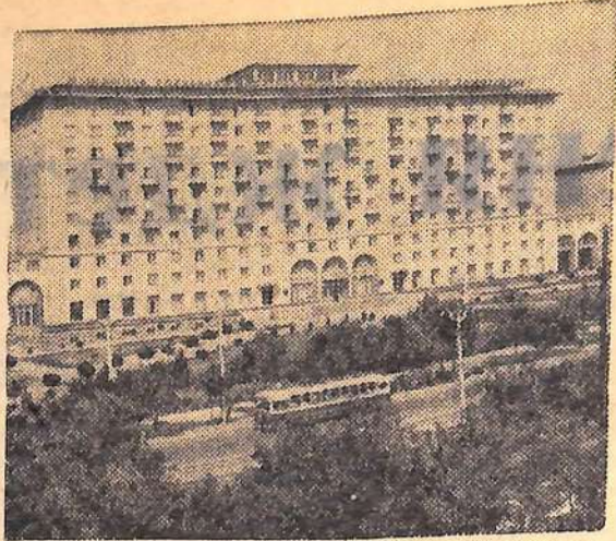
Отступая под ударами советских войск фашистские оккупанты сожгли город Донец. За послевоенные годы этот индустриальный центр Донбасса превратился в один из красивейших городов страны. На снимке: новая гостиница «Украина» в Донецке.