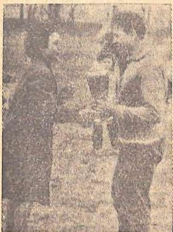
В живописном месте, у нового стадиона, 8 и 9 мая состоялись

кроссы на приз газеты «Огни коммунизма».