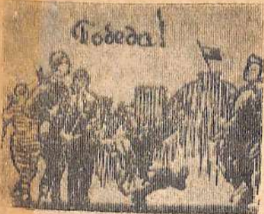
(Окончание. Начало в №№ 64, 65, 66, 68, 69, 71, 72, 73).