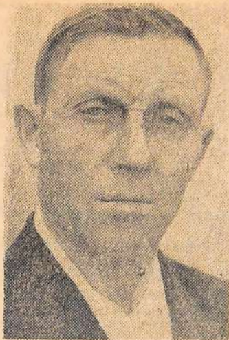
А. М. Горчаков