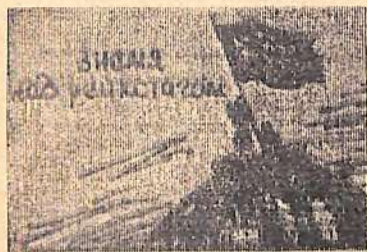
(Продолжение. Нач. в №№ 64, 65, 66, 68, 69).

И. ИЛЬИНОВ, рабочий управления дорожных и санитарных работ.