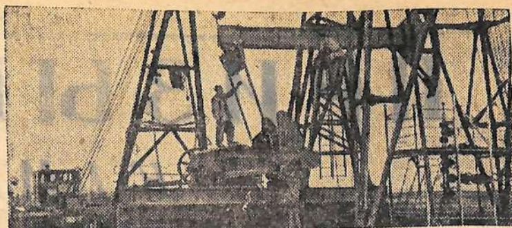
Чечено-Ингушская АССР. Участок Гойт-Корт нефтепромыслового управления «Октябрьнефть». С начала года коллектив молодого участка добыл сверх плана около 300 тонн нефти. Для повышения дебита некоторые скважины здесь переводят с фонтанной на глубинно-насосную добычу. На снимке: установка станка-качалки на фонтанной скважине.

Орган Балаковских райкома и горкома КПСС, районного и городского Советов депутатов трудящихся Саратовской области