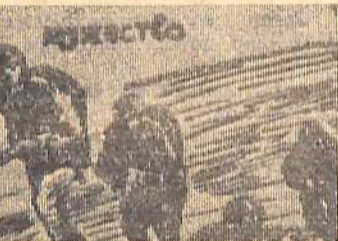
(Продолжение. Начало в № 64.)

В пояс непомятые снега. Дикий край. Тайга. Шумят метели... И одеты в пышные меха, Жалуясь, скрипят старушки-ели. Это наш ракетный горнизон,