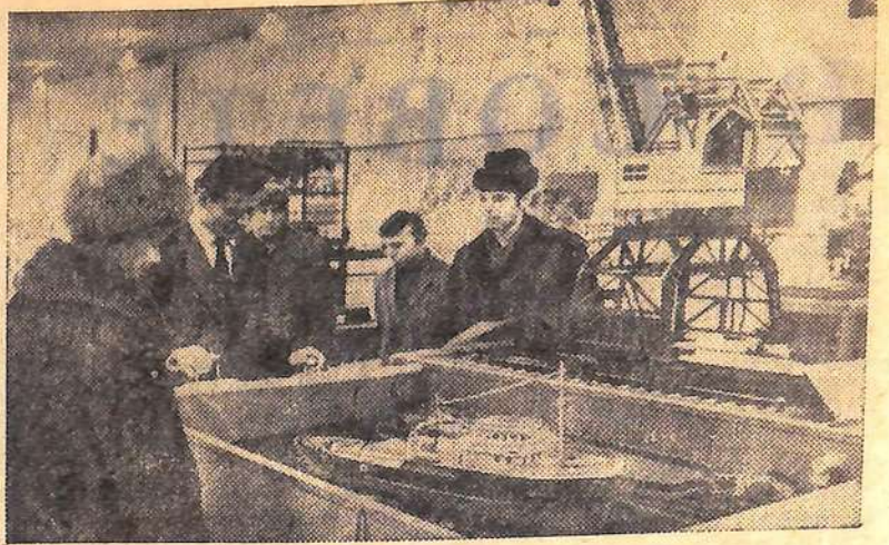
Москва. На Выставке достижений народного хозяйства СССР открылся тематический смотр экспериментально-конструкторской работы преподавателей и технического творчества учащихся средних специальных учебных заведений. На смотры представлено более 400 работ из 130 техникумов страны.