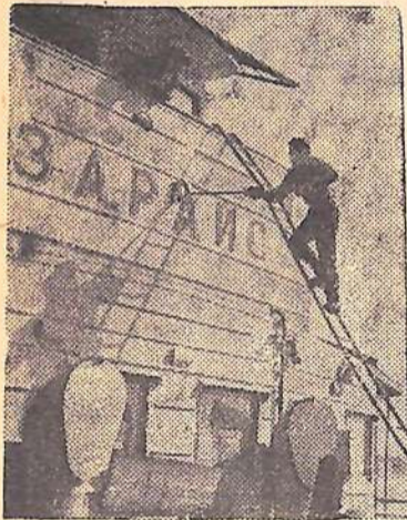
Москва. Приближается навигация. Пройдет еще немного времени, и на голубые дороги страны выйдут быстроходные корабли на подводных крыльях, грузовые и пассажирские теплоходы. Протяжными гудками возвестят они о начале навигации. А пока в Южный порт столицы продолжают поступать различные грузы — станки, кабель, запасные части. С первыми рейсами они будут отправлены в различные города страны.

На снимке: окраска судов в Южном порту.