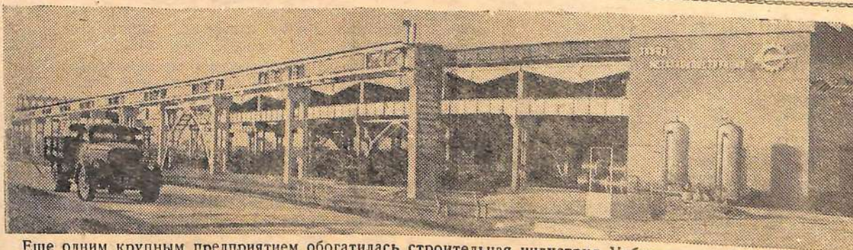
Еще одним крупным предприятием обогатилась строительная индустрия Узбекистана. Вступил в строй действующих Тойтепинский завод металлоконструкций имени сорокалетия Узбекской ССР.