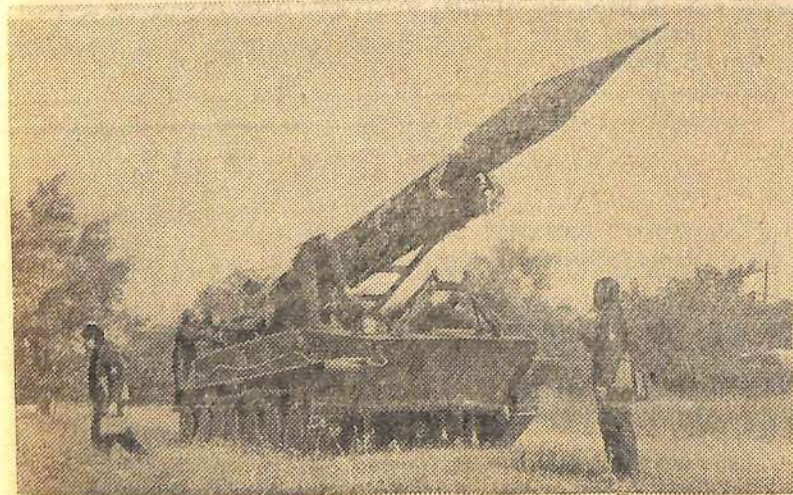
На снимке: советские ракетчики.