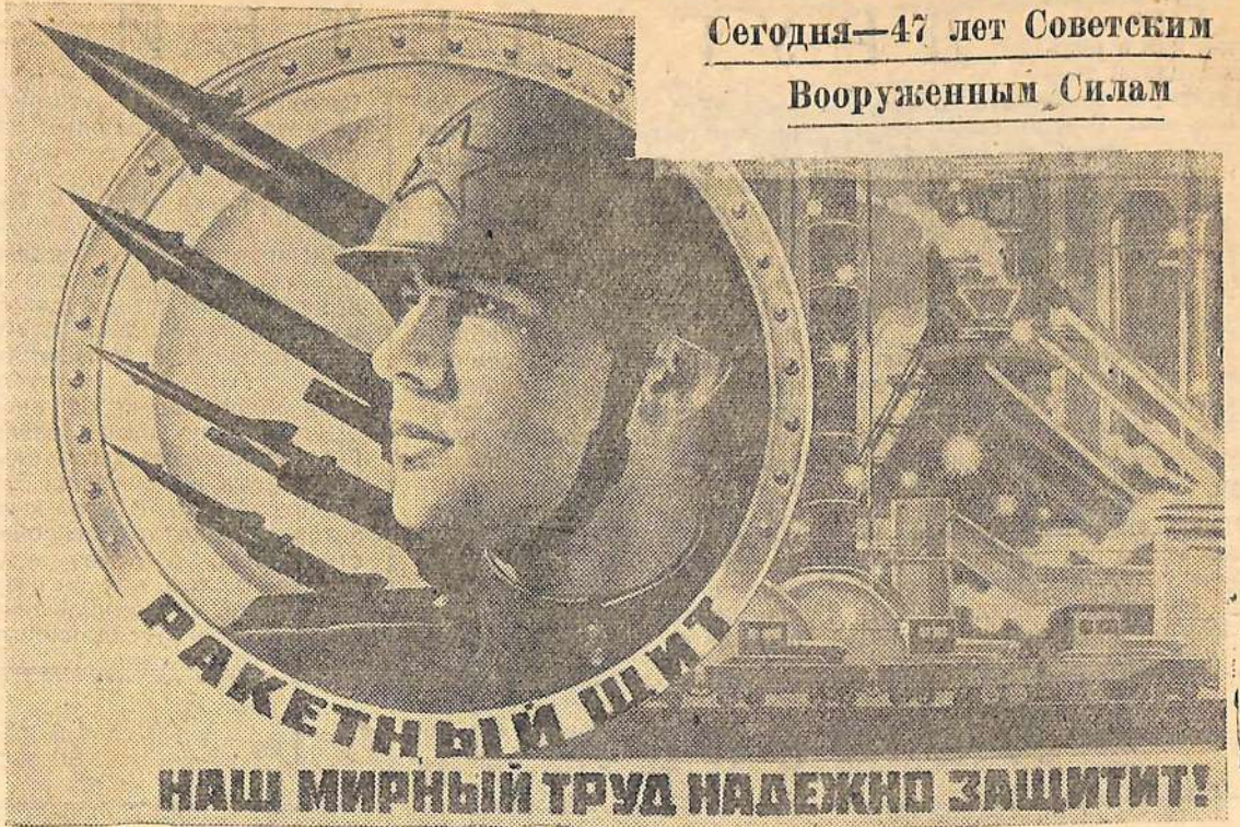
Плакат художника В. Корецкого (издательство «Советский художник»).