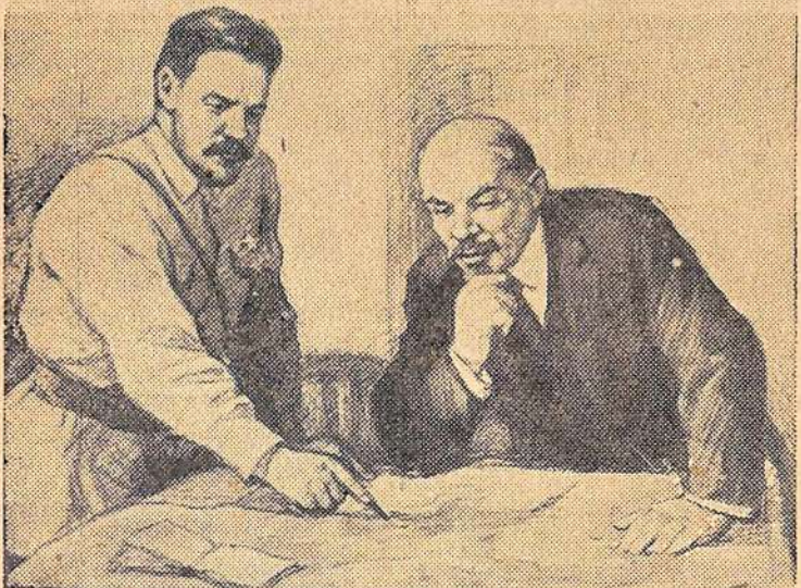
В. И. Ленин слушает доклад М. В. Фрунзе (1920 г.) Рисунок П. Васильева.

кая часть, да и толпившиеся на улице махновцы, которые в первый момент ничего не заподозрили, насторожились и схватились за оружие.