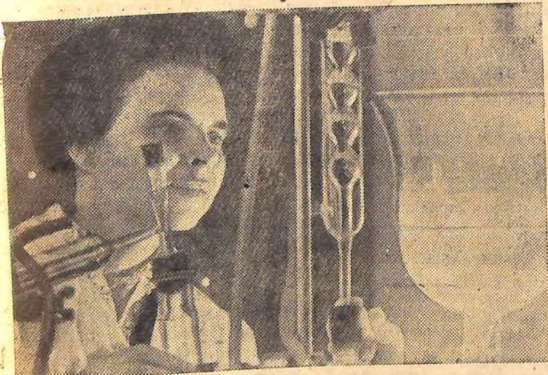
Москва. Большие отходы картофельно-крахмального производства, малоценные в кормовом отношении, заставили ученых ис-