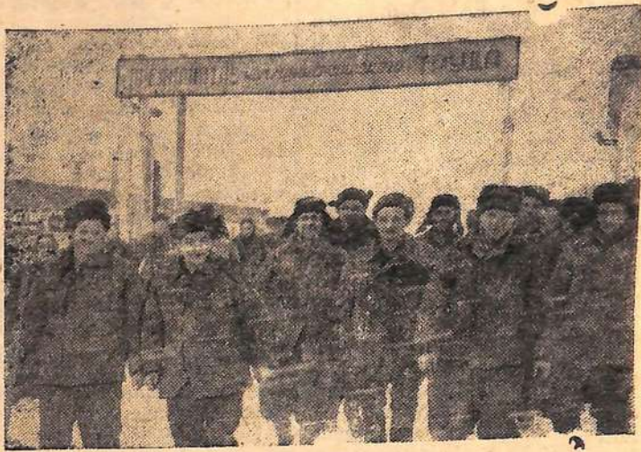
Закончилась еще одна трудовая вахта.