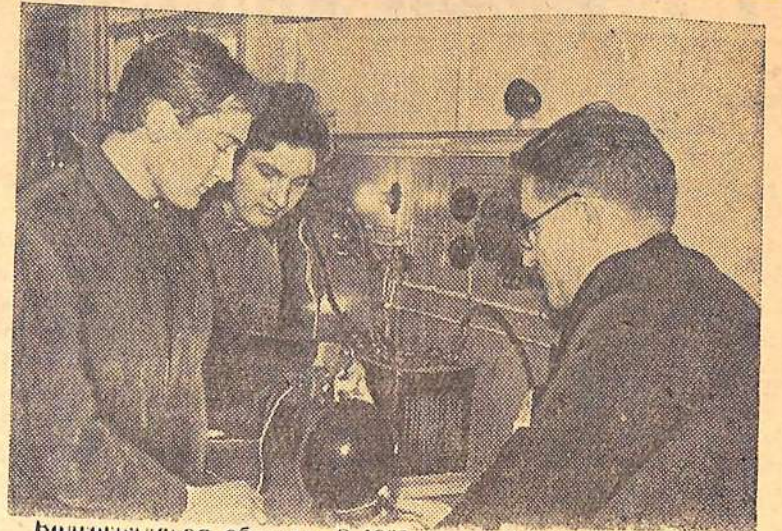
Волгоградская область В 1965 году Урюпинское сельское профессионально-техническое училище, кроме механизаторов широкого профиля, выпустит 120 электриков. Они будут заняты электрификацией животноводческих ферм, механических мастерских и других объектов в сельском хозяйстве.

В целях широкой гласности своей работы органы партгосконтроля должны активно использовать печать, радио и телевидение, систематически освещать результаты проверок, сообщать о принятых по ним мерах.