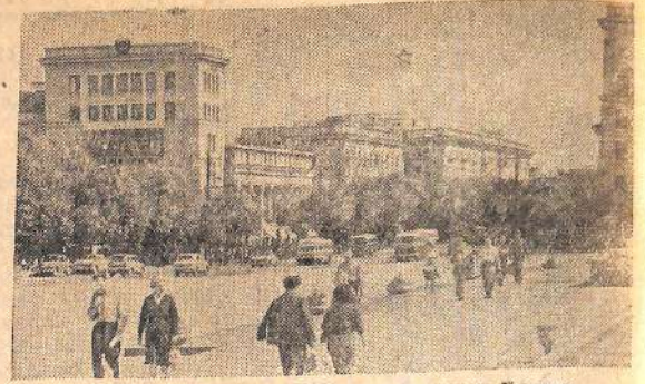
КИШИНЕВ. Вид с площади Победы на проспект Ленина.

Т. БАСАРГИНА, зав. абонементом центральной городской библиотеки.