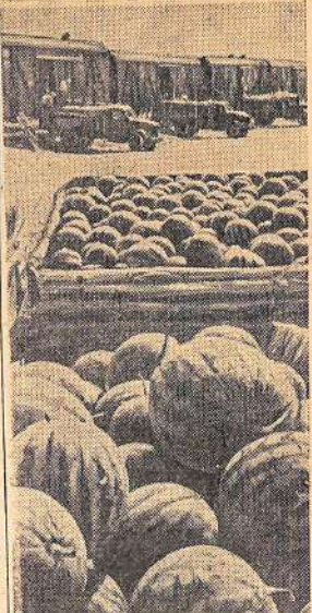
АСТРАХАНСКАЯ ОБЛАСТЬ. На всех видах транспорта отправляют отсюда в разные уголки страны знаменитые астраханские арбузы. Область уже выполнила годовое задание по продаже их государству. Только Лиманская заготовительная контора «Объединенная» за сезон отгрузила 25 тысяч тонн арбузов, значительно перевыполнив годовой план. На снимке: погрузка арбузов в железнодорожные вагоны.

И. КОСМАЧ, старший инструктор областного отдела распространения печати «Союзпечать».