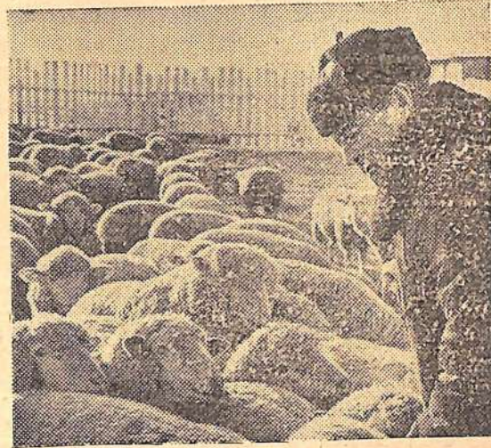
На снимке: чабан М. Файзулин со своей отарой.