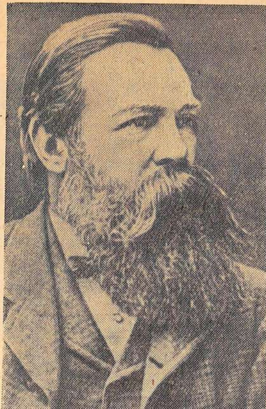
Имя Фридриха Энгельса (1820—1895), великого мыслителя, замечательного ученого и страстного революционера, глубоко чтят трудящиеся всего мира. Вместе со своим другом Карлом Марксом Энгельс был основоположником научного коммунизма — могучего идейного оружия пролетариата в борьбе за коммунистическое переустройство общества. Уже в ранних совместных трудах «Святое семейство» и «Немецкая идеология» Маркс и Энгельс заложили основы нового, ре-

Яркий образец творческого развития марксизма-ленинизма — новая Программа КПСС названа Коммунистическим манифестом современной эпохи. Следуя заветам основоположников научного коммунизма, верные принципы пролетарского интернационализма, КПСС и другие марксистско-ленинские партии борются за единство и сплоченность социалистического содружества, международного коммунистического движения. Как и предвидел Энгельс, коммунизм все более становится делом всего человечества.