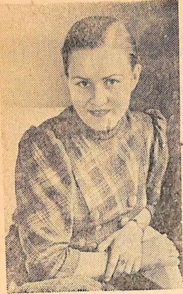
Саломея Нерис (Бачинская-Бучене), выдающаяся литовская советская поэтесса.

Сегодня исполняется 60 лет со дня рождения (1904—1945 гг.).