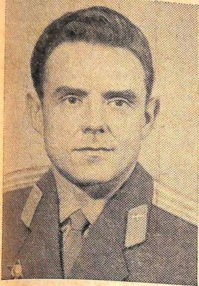
Космонавт КОМАРОВ Владимир Михайлович