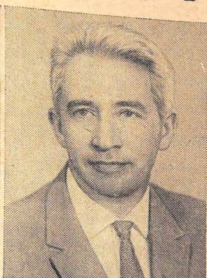
Космонавт ФЕОКТИСТОВ Константин Петрович