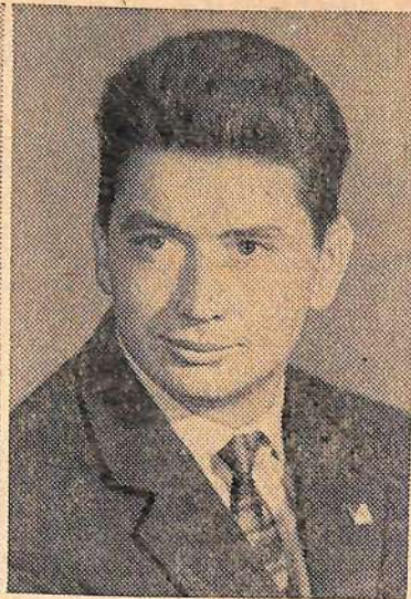
Космонавт ЕГОРОВ Борис Борисович