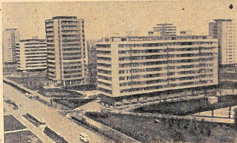
Столица Социалистической Федеративной Республики Югославии сегодня. Жилые дома в районе Нового Белграда.