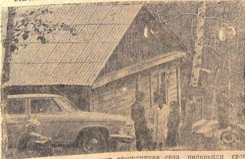
На снимке: за лето двести труженников села поправили свое здоровье в колхозном доме отдыха. Над колхозной дачей шефствуют медицинские работники курорта Шивада.

Артель борется за высокое звание коллектива коммунистического труда.