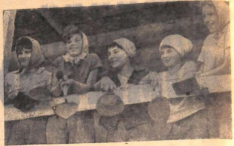
Посмотрите на этих девчат. Счастливые улыбки сияют на их лицах. Это — девушки из бригады штукатуров второго строительного управления, которой руководит Макаров. Бригада добилась высокой выработки на отделке цехов штапельного производства и в честь Великого Октября решила трудиться еще лучше.

Рубеж намечен хороший. Чтобы достичь его, бетонщики экономят рабочее время, стремятся снизить себестоимость продукции. И в этом вопросе у них есть замечательные результаты. Каждая панель стала теперь дешевле почти на один рубль. А это сотни рублей прибылей заводу. Н. БАШАРИН