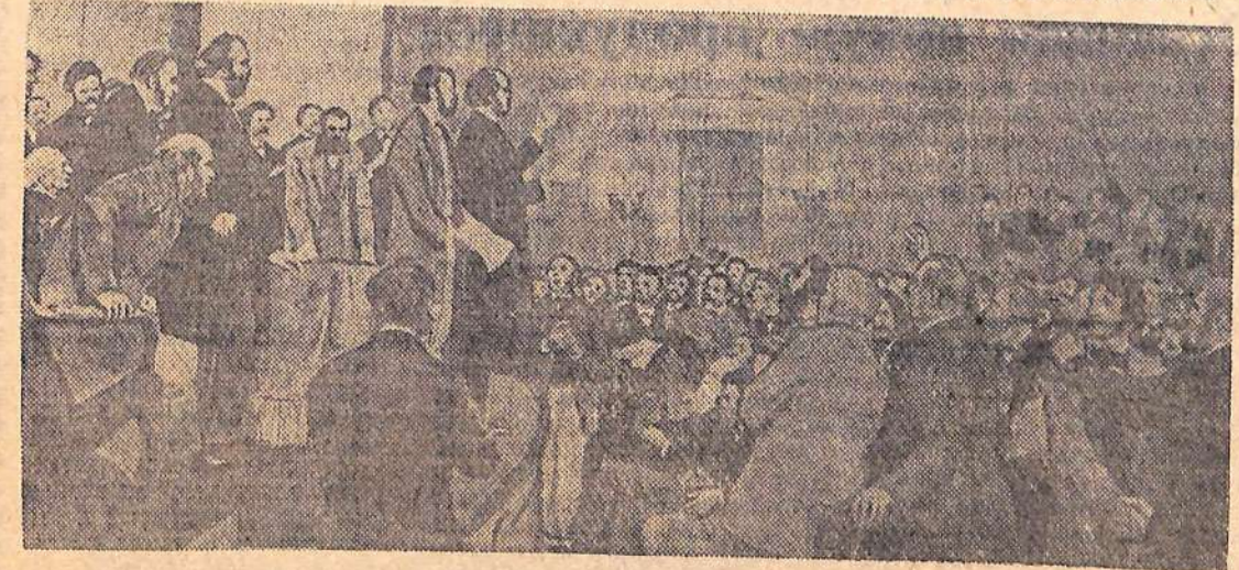
Снозание Первого Интернационала. Митинг 28 сентября 1864 года. В Сент Мартинс-Холле. (Лондон).

даниям «Манифеста Коммунистической партии», деятельности Первого Интернационала, Парижской коммуны, Великой Октябрьской социалистической революции в России, строительству коммунизма в СССР, борьбе против фашизма и войны.