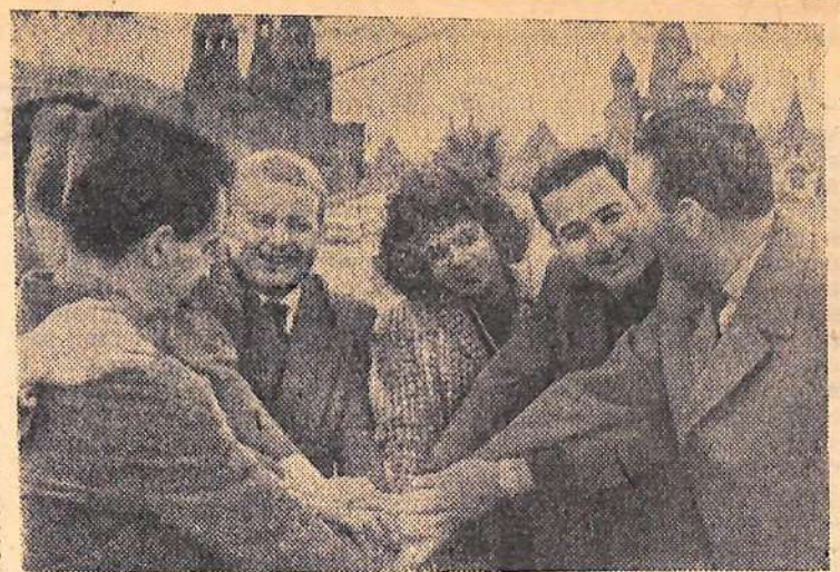
МОСКВА. В столице нашей родины проходит Всемирный форум солидарности молодежи и студентов. Небывалое по размаху в истории молодежного движения событие собрало посланцев 120 стран мира, выступающих за национальную независимость и освобождение, за мир. На снимке: группа участников форума из Чехословакии, Индонезии, Кубы и острова Маврикий на Красной площади.