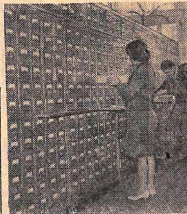
Москва. В сентябре отмечает свой юбилей Центральная политехническая библиотека. Она была основана 100 лет назад. На снимке: в справочно-библиографическом кабинете библиотеки.