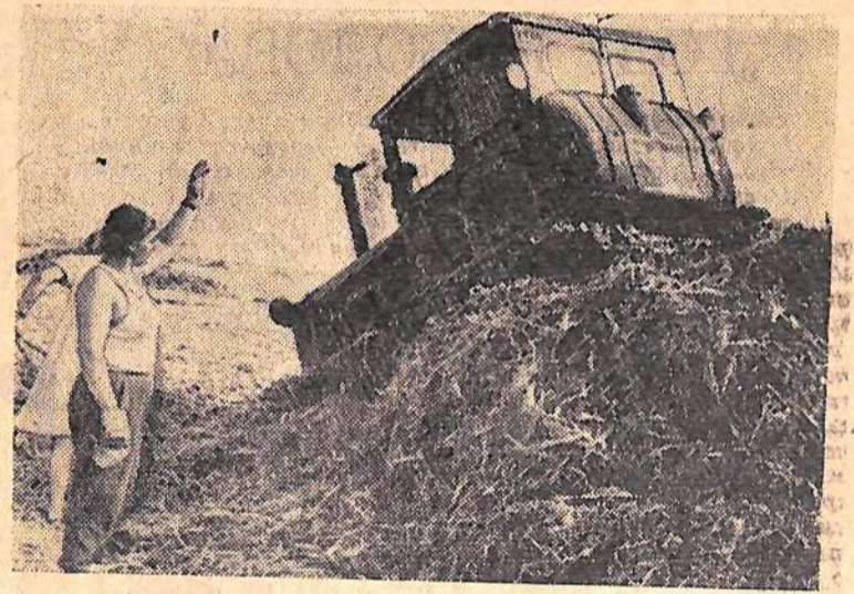
В колхозе имени Ленина на 2240 гектарах раскинулись грядки «чудесницы». Сейчас механизаторы ведут закладку зеленой массы на силос. Каждый гектар дает до 200 центнеров сочного корма.