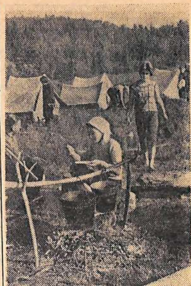
Алтайский край. Богата природа в горах, прилегающих к Телецкому озеру. Сюда на полеву практику по зоологии выехала группа студентов второго курса агробиологического факультета Горно-Алтайского пединститута. На снимке: студенты пединститута в лагере.