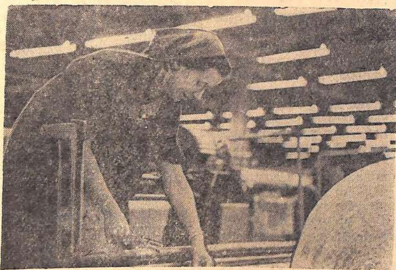
Человек славен трудом

Актюбинск. Хозяйства Западно-Казахстанского края убрали 80 процентов зерновых. Успешно ведутся обмолот и вывозка зерна на заготовительные пункты. Колхозы и совхозы уже выполнили план заготовок хлеба, засыпали в закрома Родины более 66 миллионов пудов зерна. Хозяйства Темирского производственного управления выполнили полтора плана продажи зерна государству, Казталовского управления — два плана. Почти 3 плана заготовок хлеба выполнили колхозы и совхозы Джаныбекского производственного управления.