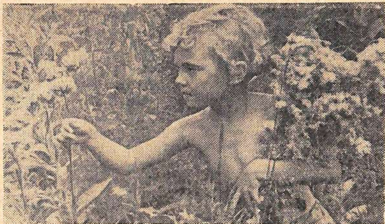
Как прекрасны луговые цветы!