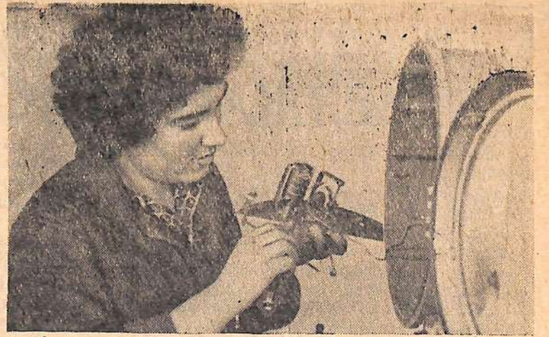
Человек славен трудом

— Девчонки, пора домой, — заглядывая мимоходом