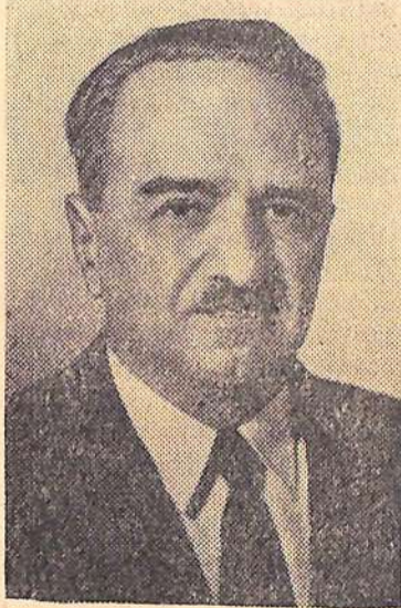
Анастас Иванович МИКОЯН — Председатель Президиума Верховного Совета СССР.